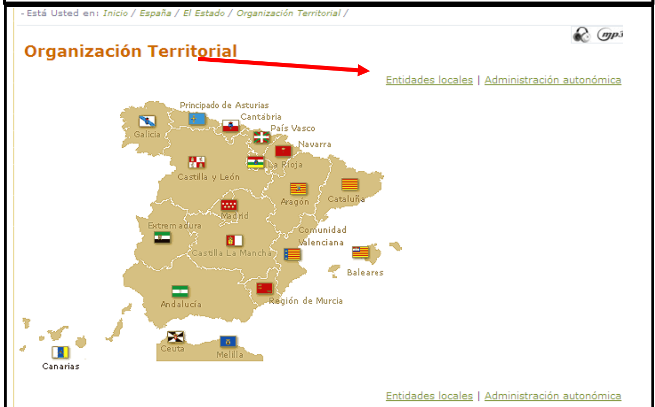
Fig. 3 AL.: Organización Territorial abrir enlace Entidades Locales