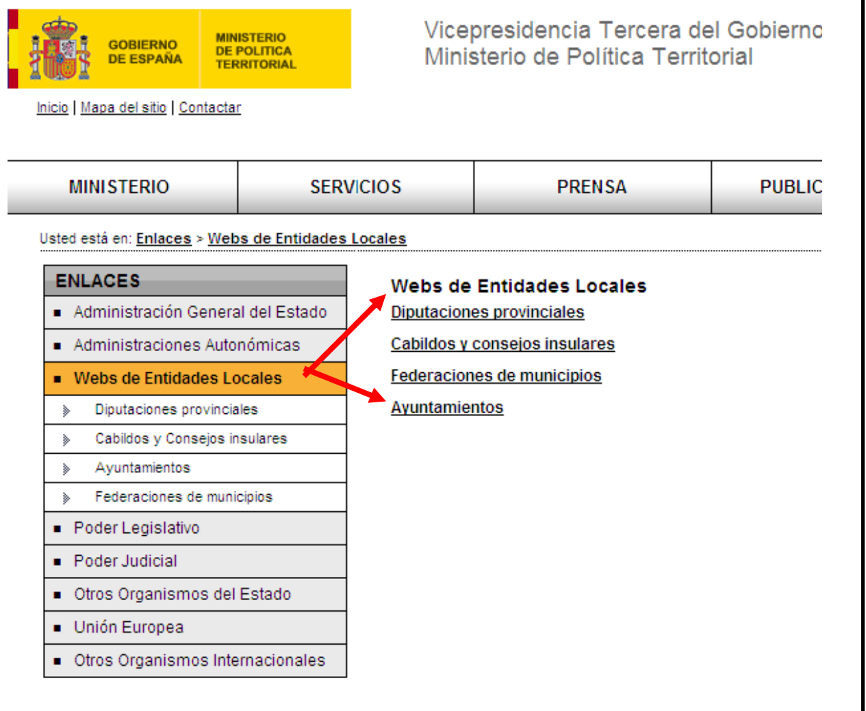
Fig. 4 AL: Abrir enlace Ayuntamientos