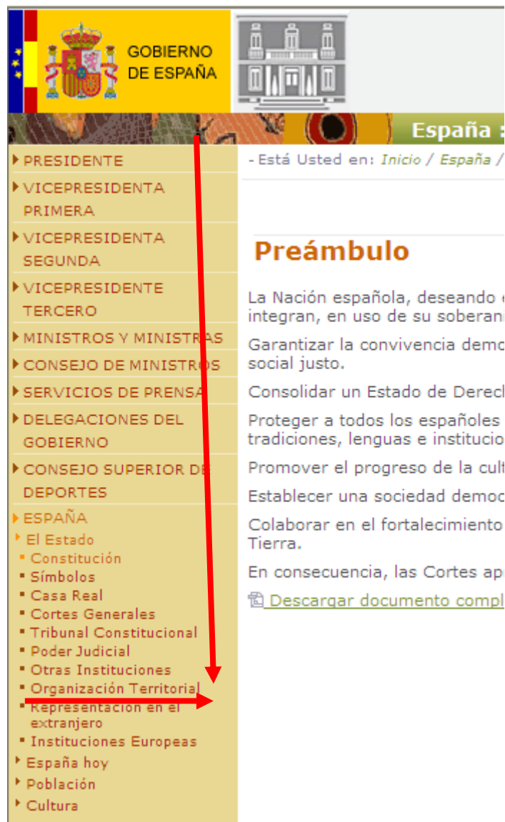
Fig. 2 AL: abrir el enlace a Organización Territorial .