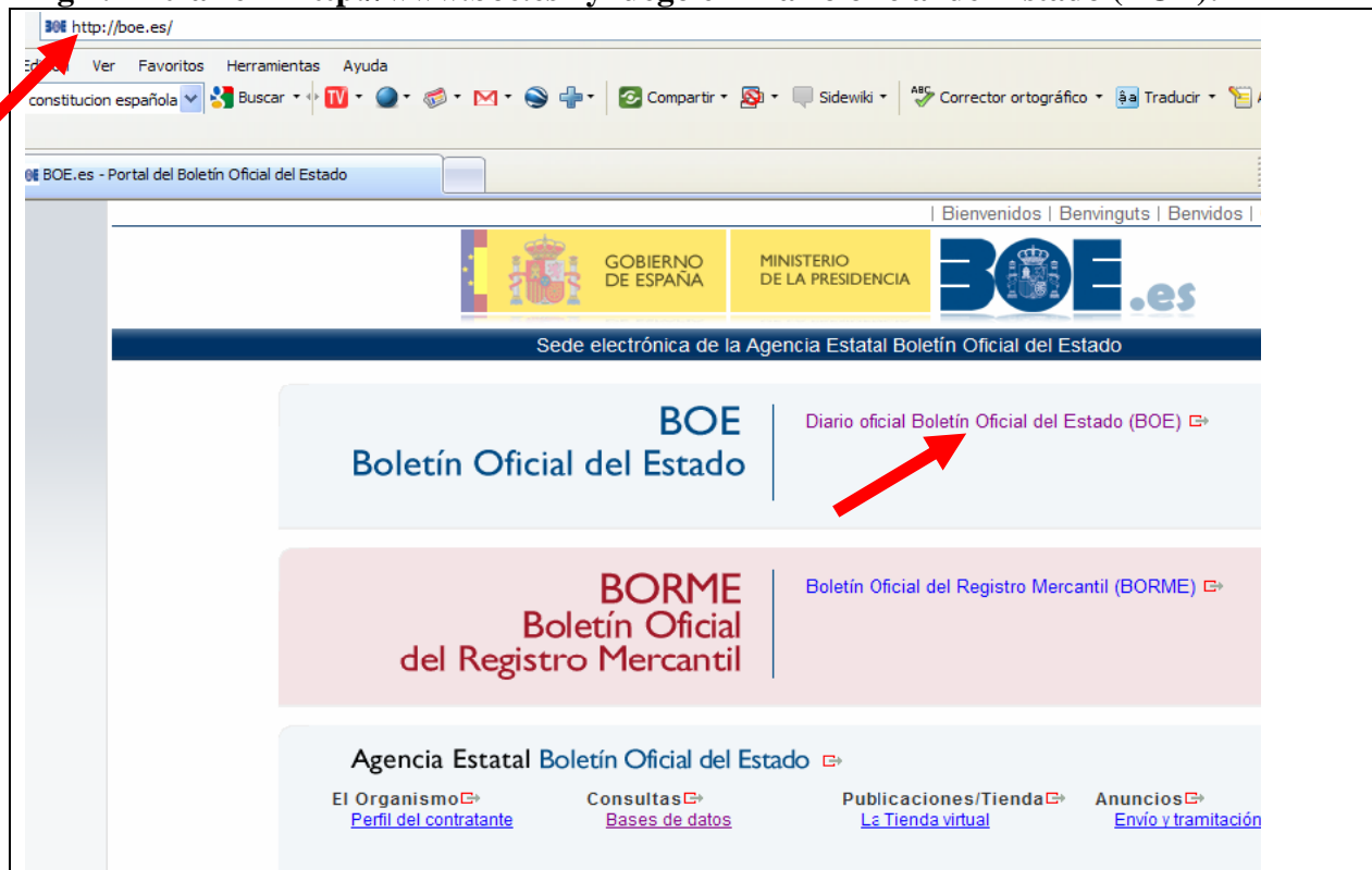
Fig2: enlaces a último BOE, Calendario, y Consultas: